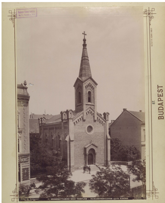
2. Rózsák tere, római katolikus (ma görög katolikus) templom. A felvétel 1894 körül készült

1878-ban átnevezik a teret Szegényház térre. Még 1856-ban épült fel itt a Wagner János tervezte, majd Hild József által módosított Elsiabethineum szegényház, a tér első épületeként. A késő klasszicista stílusú épületet 1877-ben és 1882-ben bővítette szintén Czigler Győző. Az épület ma az Erzsébet kórháznak ad helyet.