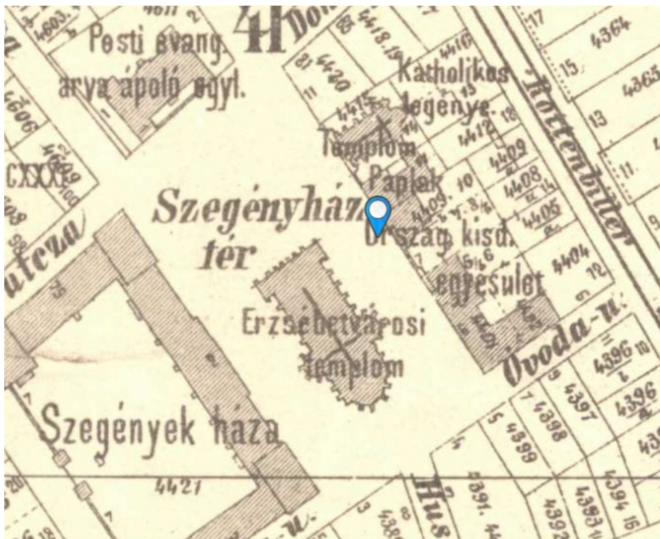
2. 1895-ös térképen, forrás: mapire.eu

A teret leginkább meghatározó épület a Szent Erzsébetnek szentelt templom, Budapest legnagyobb neogótikus temploma, Steindl Imre alkotása. A templom tervét Steindl egy 1889-ben kiírt pályázatra nyújtotta be, 1901-ben pedig már állt a templom. Vadas konferenciai tanulmányából kiderül, hogy a templomot Erzsébetnek akarták szentelni, ezért előképként is neki szentelt templomokat választottak, köztük a legjelentősebb a kora gótikus marburgi templom.