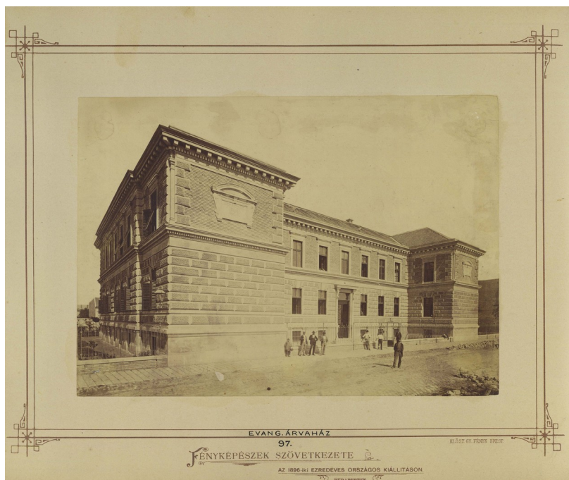
1. Rózsák tere 1., Protestáns árvaház épülete. A felvétel 1880-1890 között készült.