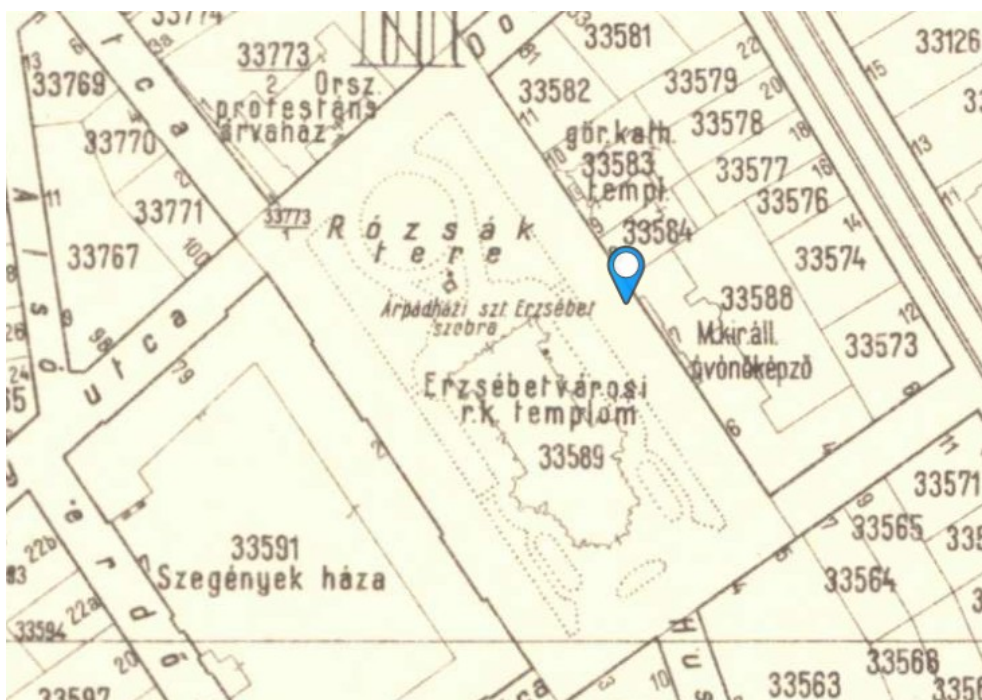
3. 1937-es térképen

A teret leginkább meghatározó épület a Szent Erzsébetnek szentelt templom, Budapest legnagyobb neogótikus temploma, Steindl Imre alkotása. A templom tervét Steindl egy 1889-ben kiírt pályázatra nyújtotta be, 1901-ben pedig már állt a templom. Vadas konferenciai tanulmányából kiderül, hogy a templomot Erzsébetnek akarták szentelni, ezért előképként is neki szentelt templomokat választottak, köztük a legjelentősebb a kora gótikus marburgi templom.